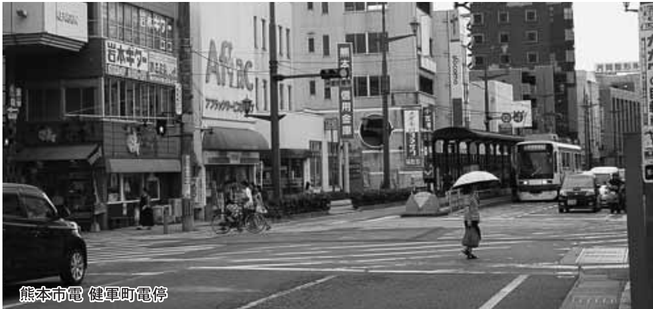
熊本市電 健軍町電停