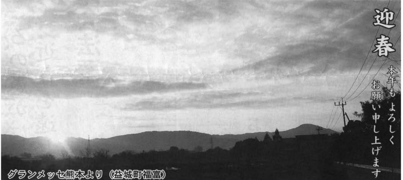
グランメッセ熊本より (益城町福富)