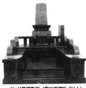
インド産御影石(敷地面積5㎡以上)

お墓づくり 愛高(あいこう) ☎096-368-1088 住/熊本市戸島西2-3345-8 営/9:00~18:00 休/不定休 (来店時は電話で問い合わせを)