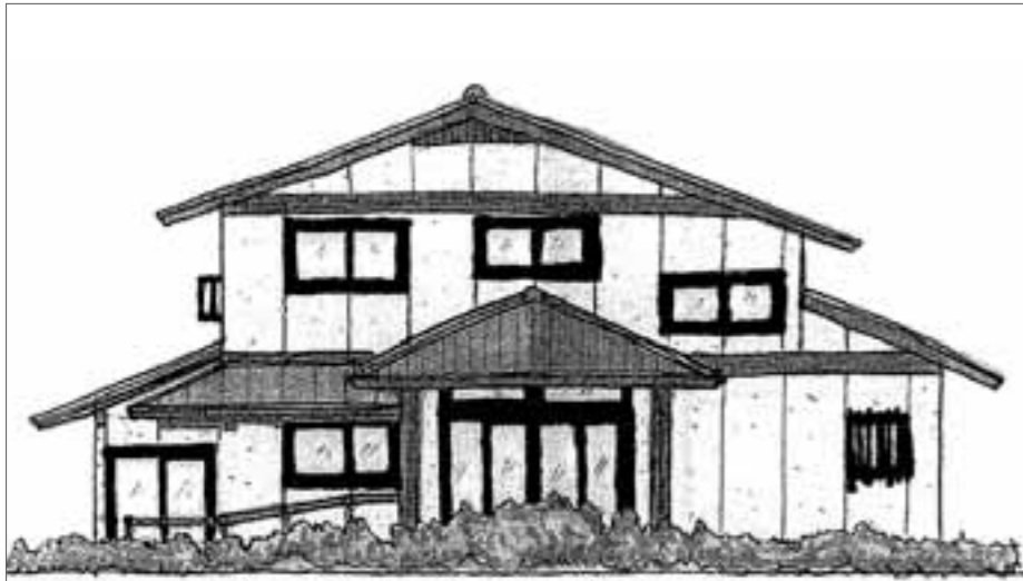
阿弥陀寺 完成イメージ図（正面）