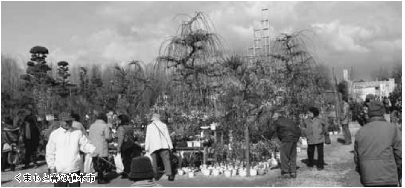
くまもと春の植木市