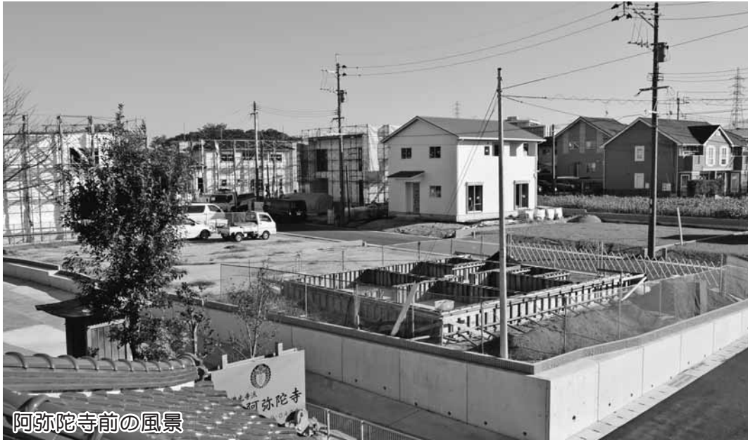
阿弥陀寺前の風景