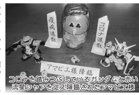
アまびこ様降臨 コロナを踏みつぶしているガシダムと赤い流星シャアを従え降臨されたアまびこ様

五十年近く前の話です。父の実家へ新年の寿ぎに出かけた夜のこと。親戚一同が集い賑わっていたところ、祖母がおもむろに私に話し掛けてきました。