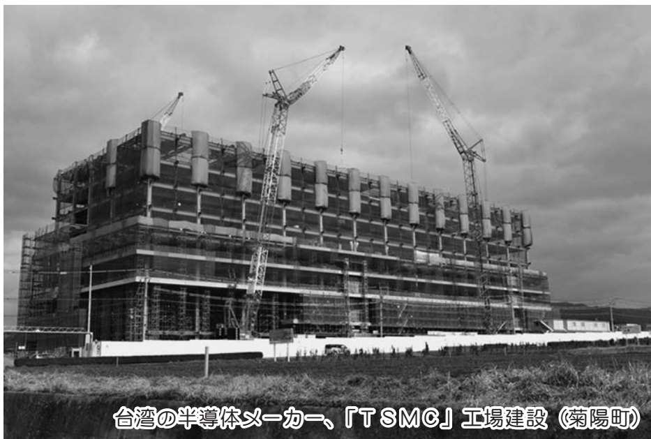
台湾の半導体メーカー、「TSMC」工場建設(菊陽町)

本山佛光寺 慶讃法会 きょうきんげうえ 令和5年5月12日(金)〜14日(日) 19日(金)〜21日(日) 26日(金)〜28日(日)