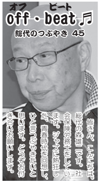
おフ・ビート Off・beat 総代のつぶやき 45

した。その道中には広大な砂漠がありました。それがタクラマカン砂漠です。タクラマカンとはウイグル語で「二度入つたら出られない」という意味です。同じ景色がどこまでも続き、夜は闇に包まれて何も見えません。しかし、玄奘は迷うことなく進めました。それは同じ志を持ちながら、息絶えた方のお墓があったからです。先人方は後世